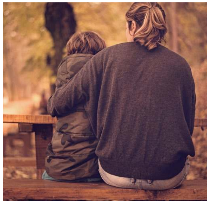
Mutige Mutter beschützte ihr Kind vor obszöner «Sexualaufklärung».

Kurzum: Die Eltern des 11-jährigen Knaben und die besagte Mutter konnten ihre Kinder zu Hause lassen. Weil es kritische Eltern gab, fand der Unterricht mit Zurückhaltung statt!