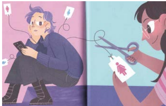
Un calendrier scolaire tessinois LGBTIQ induit en confusion les élèves de 5e: «Chacun a le droit d'être la personne qu'il veut, selon son ressenti.»

qui dirige le Département de l'Instruction publique (DECS 2 ), qu'elle empêche la distribution de ce calendrier, affirmant qu'il s'agit d'une opération de lavage de cerveau amenant la confusion sexuelle, rejetant aussi l'idée d'un «troisième sexe». Cette protestation n'a pas été tout à fait vaine, puisque certaines communes ont décidé de ne pas distribuer ce calendrier aux enfants, ou alors par l'intermédiaire des parents.